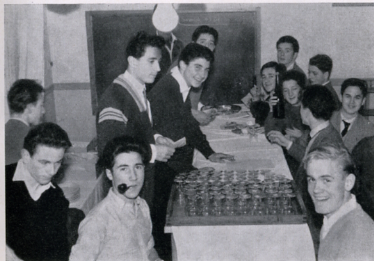
Le bar du « boulot »