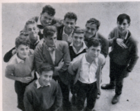
On sourit sous la fenêtre du Directeur...

23 septembre : Rentrée. « Gallia », « Ormes » et « Sapinière » redevennent des ruches bourdonnantes. Près de 200 internes arrivent pour la nouvelle année scolaire.