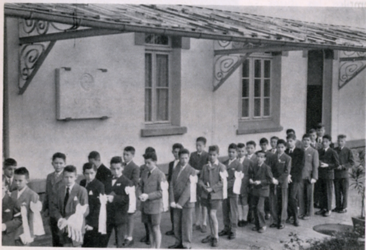
19 mai 1955, Ascension de Notre-Seigneur, la Première Communion de nos élèves En haut : la Profession de foi