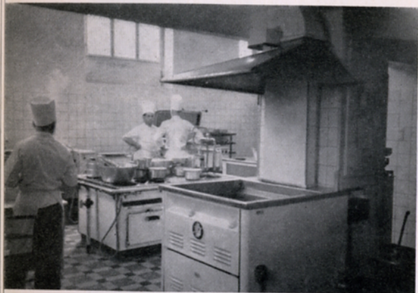
La nouvelle cuisine