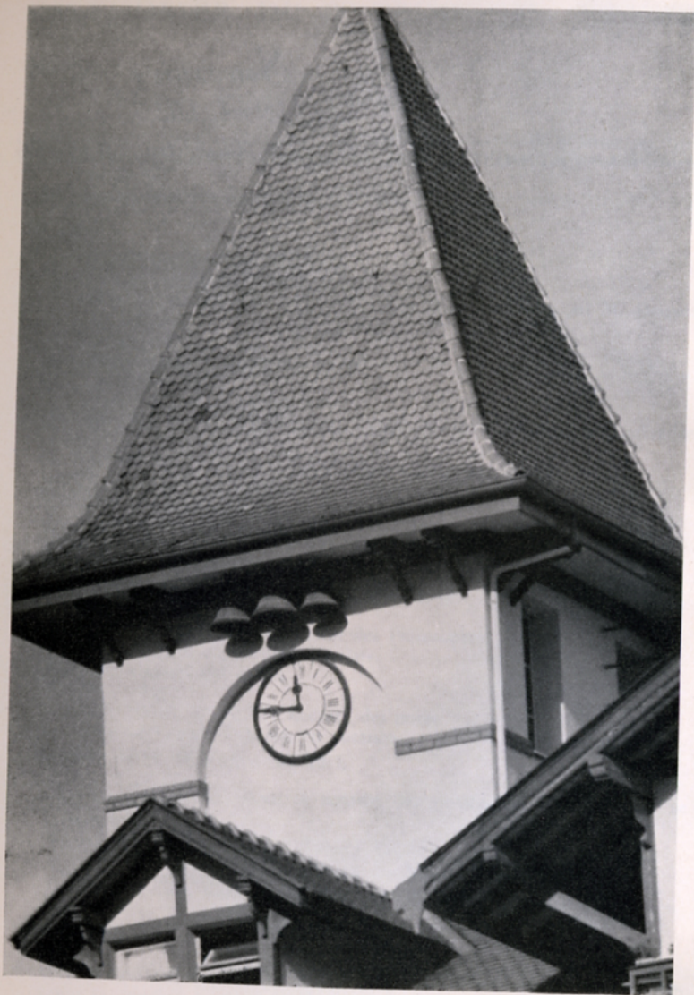
Au fil des heures...